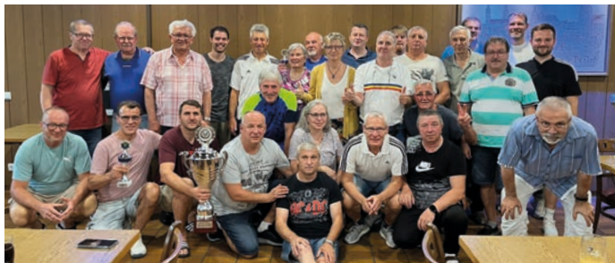
▲ Alle Teilnehmer des Dracula-Turniers

Liebe Leserinnen und Leser, die Saisonvorbereitung ist abgeschlossen, die ersten Wettkämpfe haben wir hinter uns. Es gibt Licht und Schatten, Verletzungssorgen, Höhepunkte. Aber eins verbindet uns alle: der Kampfgeist und die Freude am Kegelsport.