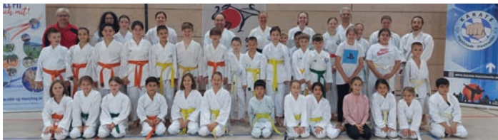
▲ Fröhliche Teilnehmende beim Kids Day in Manching

Am Sonntag, den 22. September, richtete die Karate-Abteilung des TSV IN-Nord einen Lehrgang für den Bayerischen Karatebund (BKB) mit hochkarätigen Trainern aus: Jamal Measara (9.Dan Kyoshi), Werner Bachhuber (6.DAN Karate, 5.DAN Kobudo) und Elmar Griesbauer (6. Dan) kamen zu uns nach Ingolstadt. Trotz gut organisierter Vorbereitung durch die Abteilung, die sich auch um das Catering kümmerte, kamen leider nur wenige Teilnehmende zusammen, vielleicht terminlichen Überschneidungen und auch dem wunderbaren Herbstwetter an diesem Tag geschuldet. Der Qualität des Lehrgangs tat dies jedoch keinerlei Abbruch – in familiärer, intensiver Atmosphäre gaben die Dozenten ihr umfassendes Wissen in kleinen Gruppen weiter, was letztendlich alle sehr begeisterte. Es war ein Genuss, für den wir uns herzlich bedanken!